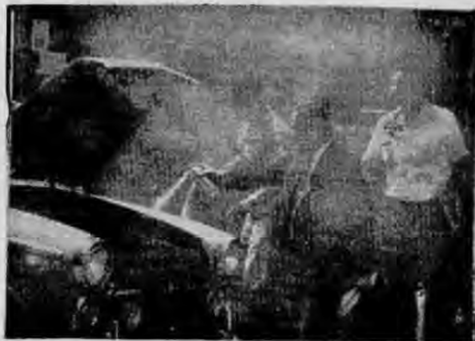
Ayer en la mañana, un vehículo del Consejo Superior de Defensa Social sufrió un circuito eléctrico que provocó llamas en la parte del motor. Afortunadamente el chofer presto se apresuró a extinguir el fuego; luego aparecieron otros videntes que lo ayudaron en su tarea. El vehículo no sufrió daño alguno, pero el chofer sí sufrió tamaño susto. Un caso como hay tantos...