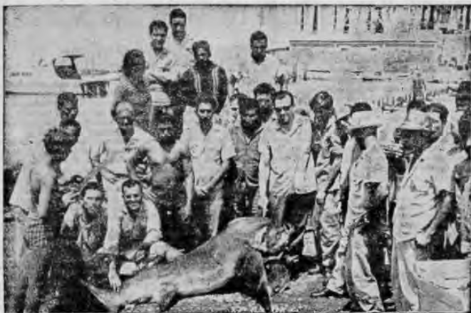
CARACAS.— Pesca del Tiburón. Pescadores venezolanos observan la rara especie de "Tiburón-Zorr", que ocasionalmente cayó en las redes de un pescador que se hallaba en la costa tratando

de pescar. Tiene un largo de 1,70 y sus características son parecidas a las del tiburón corriente. En Venezuela la pesca del tiburón constituye un deporte dada su abundancia.