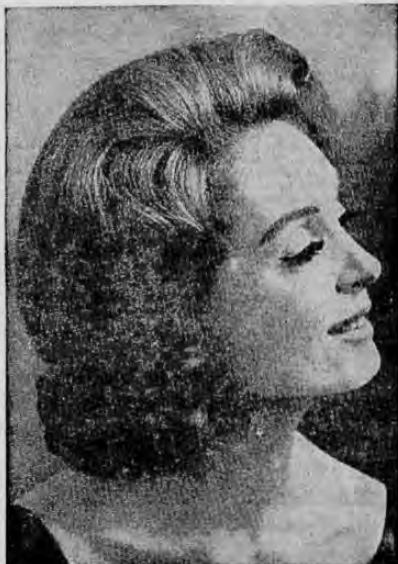
Haga linda y seductor ese pelo pardo y apagado, poniéndolo en éj armbarinas suyas. Un simple shampoo puede hacer el truco.

Muy atrinca, sobre el perfil del techo de edificio "Europa-Center" en Heredia Occidental (en el fondo, la ruina de la Iglesia Comemorativa de Kaiser Wilhelm), cantó, ante invitadas y reporteros, Freddy, el cantante de canciones de moda y az de "mus clubs" de mayor éxito de Alemania. Fue el preludio a una fiesta triunfal: Freddy había recibido su décimo Disco de Oro "Freddy en Alta mar" y la Copa de los Autores Europeos de Canciones de Moda como "cantante con la mayor cota de ventas". El antiguo marinero, nacido en Hamburgo, conquistó los corazones del público sobre todo con sus canciones marinas. También en el Musical "Nostalgia de St. Pauli", en cuya representación están siempre vendidas todas las localidades. Freddy desea peña a nivel de marino. Tiene invitaciones para tocar en varios países, entre otros a la Argentina. Los expertos están convencidos de que la carrera del simpático hamburgués, que empezó hace doce años, aun no ha llegado a su apogeo.