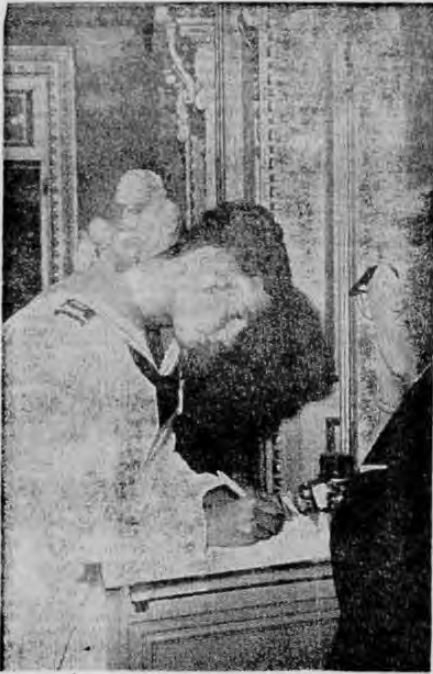
Dirigiendo el libro de visitantes en el Teatro Nacional S.A.R. el Príncipe Heredero de Suecia durante su visita a nuestro primer coliseo.