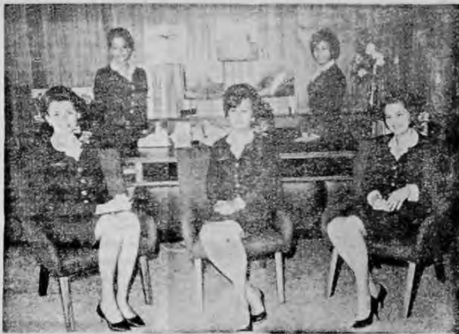
Grupo de empleadas de IBERIA, Líneas Aéreas de España que prestarán su ayuda en la venta de acciones para dos viajes a España, en el pabellón español de la Feria de las Flores.